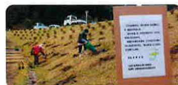
公園などで緑化(田川郡春春町) ダム公園の植栽