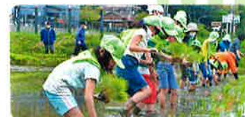
緑の少年団(飯塚市) 地域の人たちとの田植え

緑の募金は「緑の募金による森林整備等の推進に関する法律」 に基づき(公財)福岡県水源の森基金が福岡県知事の 指定を受けて行っています。