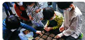
体験学習(久留米市) どんぐりの種植え