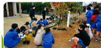
学校緑化(古賀市) 中庭の植樹