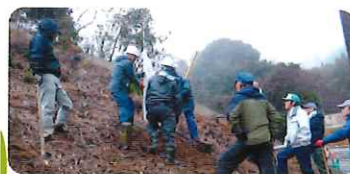
森林整備(香春町) 香春町での樹木植栽