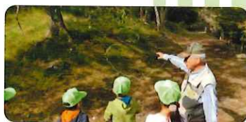
緑の少年団(篠栗町) 樹木観察会

緑の募金は「緑の募金による森林整備等の推進に関する法律」 に基づき(公財)福岡県水源の森基金が福岡県知事の 指定を受けて行っています。