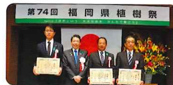
イベント(遠賀郡遠賀町) 第74回福岡県植樹祭