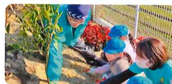
学校等緑化(久留米市) 園庭の緑化